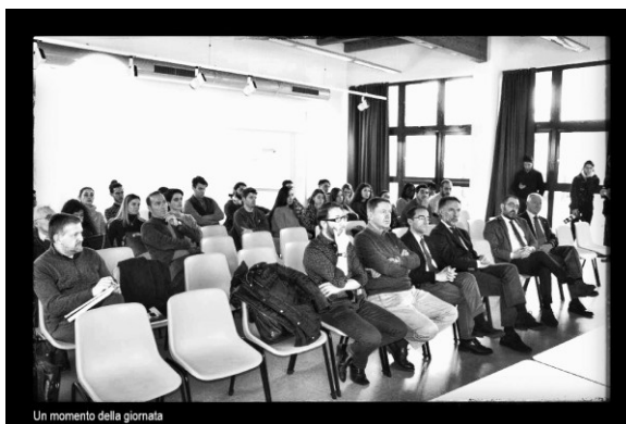
Un momento della giornata