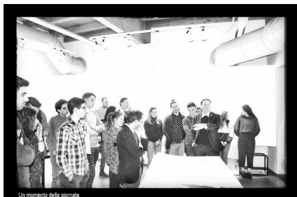
Un momento della giornata